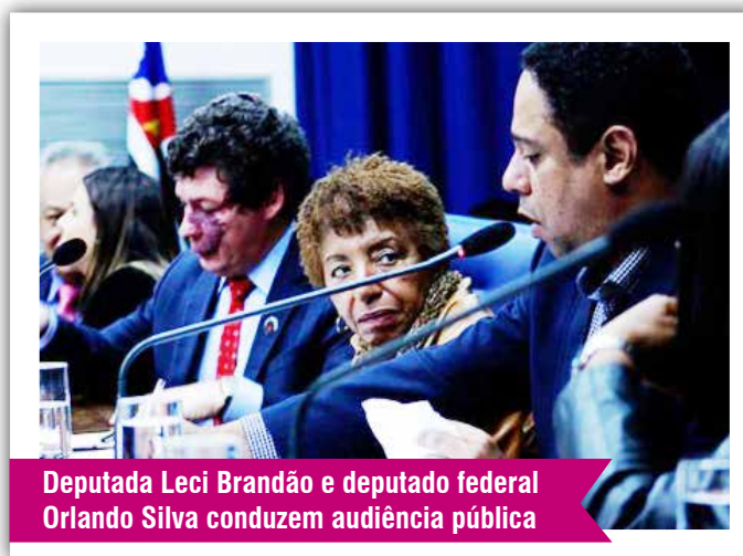
Deputada Leci Brandão e deputado federal Orlando Silva conduzem audiência pública

A comissão, liderada por Leci, pode contribuir, também, com a elaboração de projetos específicos que contribuam para solucionar a situação grave em que se encontra a juventude paulista negra, pobre e das periferias.