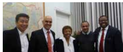
05/05 – Audiência com o Secretário de Segurança Pública Alexandre de Moraes. Na pauta: fortalecimento da Delegacia de Crimes Raciais e Delitos de Intolerância, ampliação dos serviços da Delegacia da Mulher e audiência com jovens lideranças dos pancadões de cidades do interior do estado