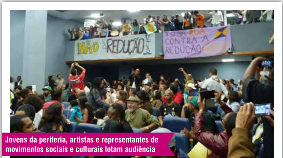
Jovens da periferia, artistas e representantes de movimentos sociais e culturais lotam audiência

A formação de uma Comissão Especial na Alesp, com o objetivo de contribuir e acompanhar os resultados da CPI Federal, foi uma das propostas apresentadas na audiência.