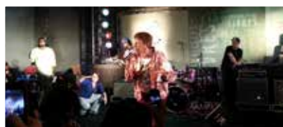
Lançamento da Rede Jornalistas Livres, no Paço das Artes, região central de SP