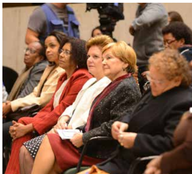
Homenageadas com a Medalha Theodosina Ribeiro 2015