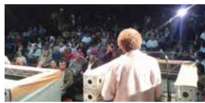
30/05 – Sessão da Câmara no Seu Bairro, no CEU Caminho do Mar, no Jabaquara