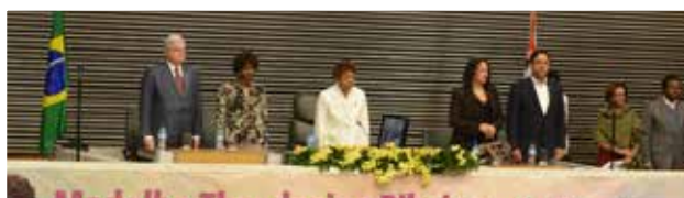
Abertura da Sessão Solene Medalha Theodosina Ribeiro