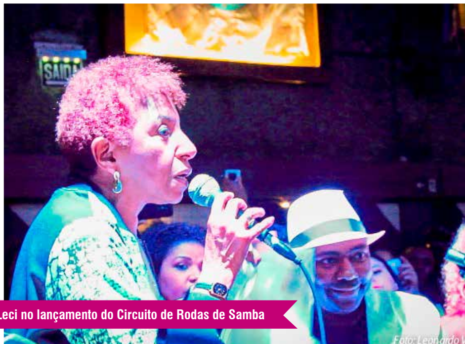
Leci no lançamento do Circuito de Rodas de Samba

Desde o dia 23 de julho os paulistanos contam com um guia com informações sobre as comunidades de samba de São Paulo. Produzido pelo mandato da deputada Leci Brandão e pela Astec (Associação dos Sambistas, Terreiros e Comunidades de Samba de São Paulo), o guia é uma das sugestões apontadas durante audiência pública realizada por Leci com as comunidades, na Assembleia Legislativa, em 2013. Durante o evento de lançamento foram comemorados os aniversários das comunidades Maria Cursi, Samba da Laje, Samba da Vela e GRES Quilombo. A primeira edição reúne informações sobre 27 rodas de samba.