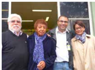
02/07 - Visita ao Centro de Atenção Psicossocial Infantil da Vila Maria / Vila Guilherme