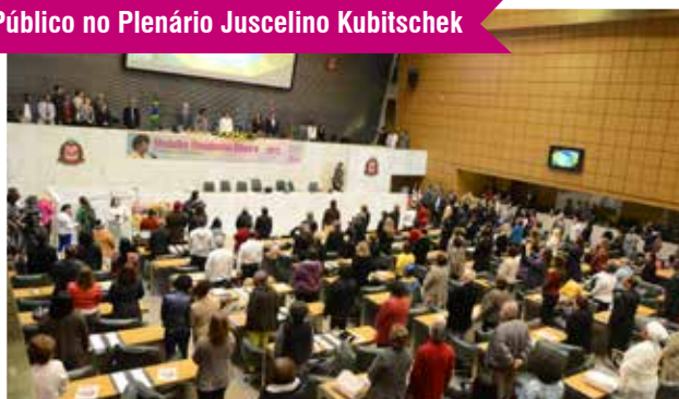
Público no Plenário Juscelino Kubitschek