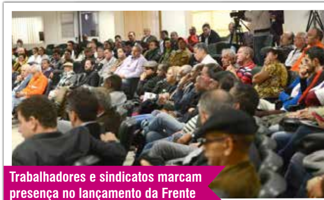
Trabalhadores e sindicatos marcam presença no lançamento da Frente

O evento foi um grande ato político, cuja principal função foi iniciar os debates sobre os trabalhadores petroleiros, manutenção e geração de emprego, renda e desenvolvimento promovidos pela Petrobras no estado de São Paulo.