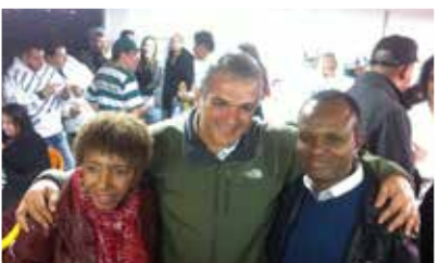
20/06 – Sorteio da liga das escolas de samba na Virada Cultural 2015