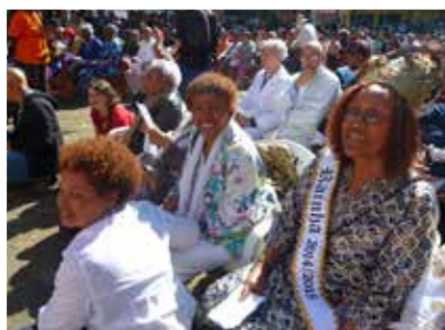
21/06 – 14ª Festa da Igreja do Rosário dos Homens Pretos da Penha de França