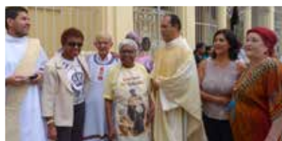
19/04- Festa de São Benedito na Igreja de Nossa Senhora da Achirópita, no Bixiga, realizada pela Pastoral Afro