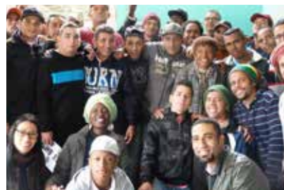
01/06 – Visita à Associação Lapidar, entidade que atende dependentes químicos, em Atibaia